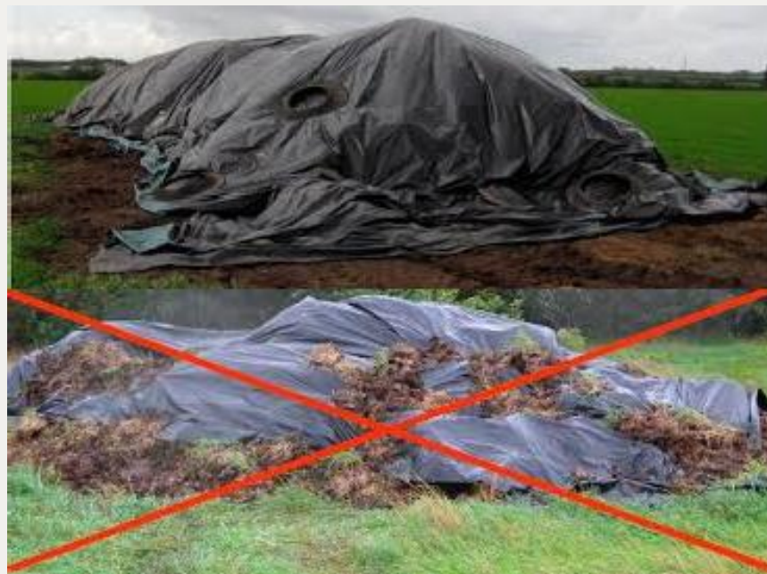
Billedbeskrivelse: Øverste billede viser en korrekt overdækket markstak. På det nederste billede er der anvendt gødning til at holde plastikken på plads, hvilket ikke er gangbart.

Markstakken må højst ligge det samme sted i 12 måneder, og en ny markstak må først lægges det samme sted igen efter 5 år. Du skal føre årlige optegnelser over, hvor dine markstakke er placeret og gemme optegnelserne i mindst 5 år. Optegnelserne skal omfatte oplysninger om oplagringsperiode og placering, for eksempel ved angivelse på et kort.